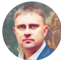
Юрий Трофимов, Министерство культуры Омской области